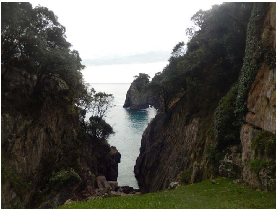
Exterior de la cueva de El Pindal